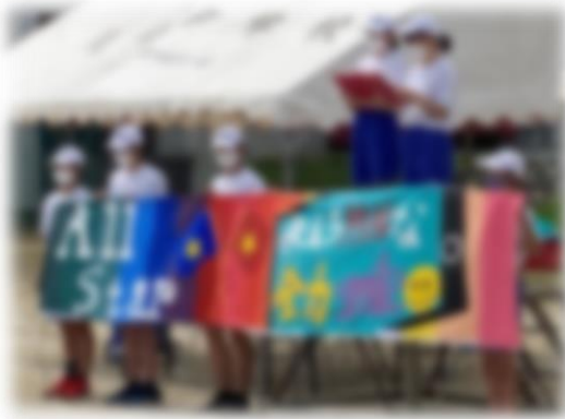
【スローガン発表の様子】